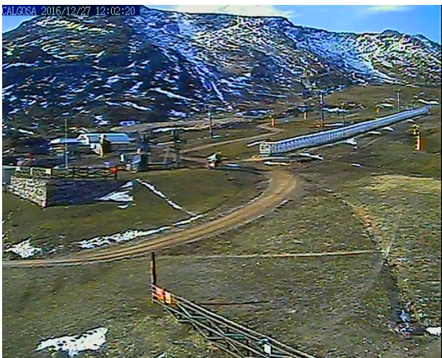
Imagen de Alto Campoo el 27 de dic de 2016